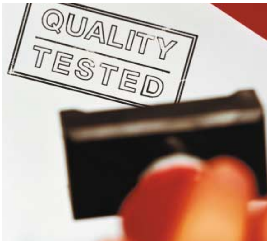
Tabel 1. Selectie en toetsing 2004